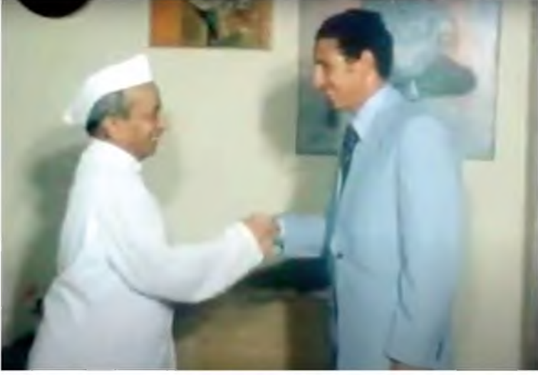
جانب من استقبال عبد السلام جلود في الهند، 17 / 7 / 1978 .